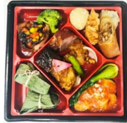
【招福門特製おつまみセット】