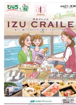
【びゅう旅行商品パンフレット】