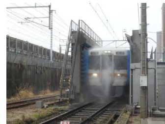
JR東海静岡車両区 (車体洗浄機)

※上記の他、往路車内にて崎陽軒のお弁当とペットボトルお茶500ml、1本付をお渡ししますので、到着後好きな場所でお召し上がりいただけます。