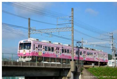
ちびまる子ちゃんラッピングトレイン