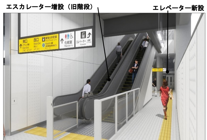
ホーム階からのイメージ