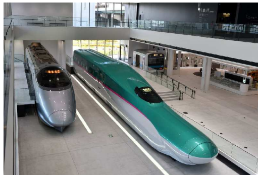
E5系新幹線電車（モックアップ）