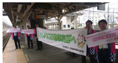
【駅ではアルパカもお出迎え】