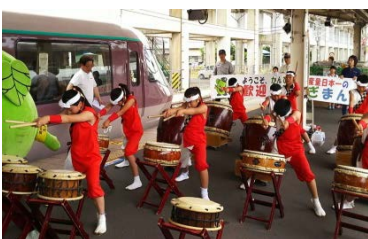
【小金井駅：愛泉童子太鼓演奏】