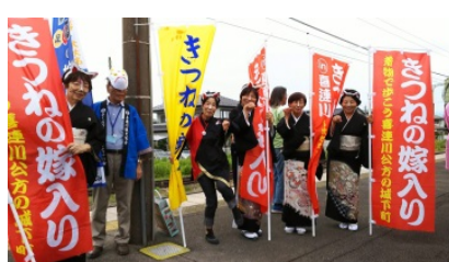
【氏家駅のお出迎え】