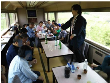
【蔵元による試飲会】