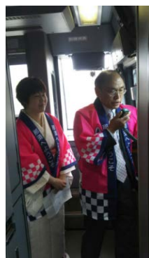
【往路列車内での車内放送】