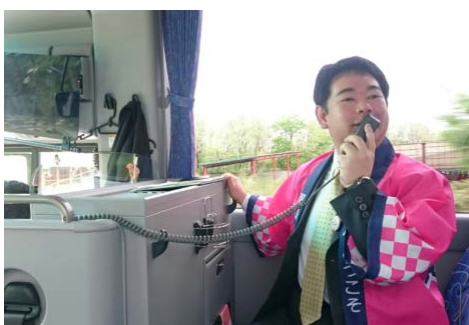
【バスでの観光ガイド】