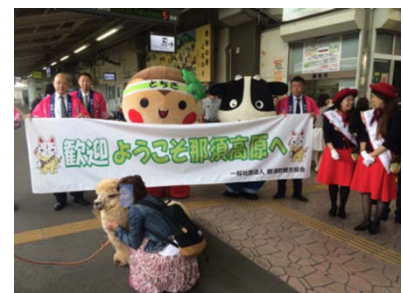
【黒磯駅でお出迎え】