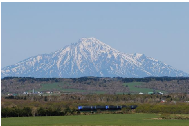
【サロベツ原野と利尻富士】