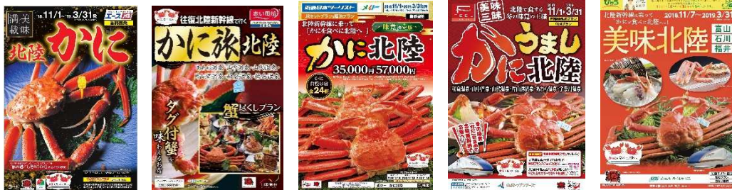
(画像はすべてイメージ)