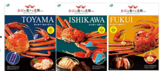
駅貼りポスター（イメージ）

北陸3県が誇るブランドガニ（富山県「高志の紅ガニ」・石川県「加能ガニ」・福井県「越前がに」）をビジュアルにした駅貼りポスターを掲出します。