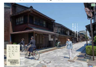
「鋳物師の町」篇ポスター