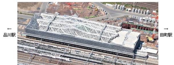
品川新駅（仮称）工事写真（2018年5月時点）