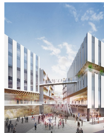
交通広場より (イメージ)