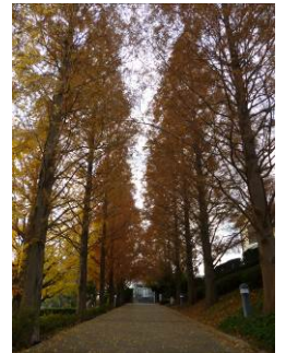
山手イタリア山庭園