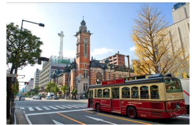
横浜市開港記念会館（ジャックの塔）