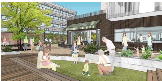
多世代交流の広場