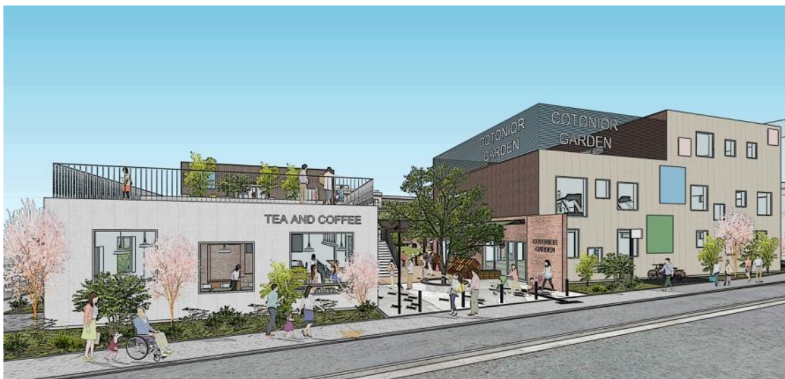
まちのエンタランス