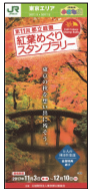
スタンプラリー台紙（イメージ）