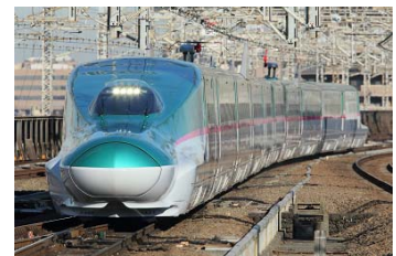
〈東北新幹線 E5系(イメージ)〉

大宮駅・小山駅・宇都宮駅・那須塩原駅・新白河駅・郡山駅・福島駅・白石蔵王駅・ 仙台駅・古川駅・くりこま高原駅・一ノ関駅・水沢江刺駅・北上駅・新花巻駅・盛岡駅