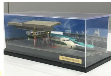
〈ジオラマディスプレイ〉 ※実物とはデザインが異なります

東北新幹線開業 35 周年を記念して JR 東日本と鉄道模型メーカー KATO がコラボレーション。模型の世界で新旧新幹線の並列を再現！