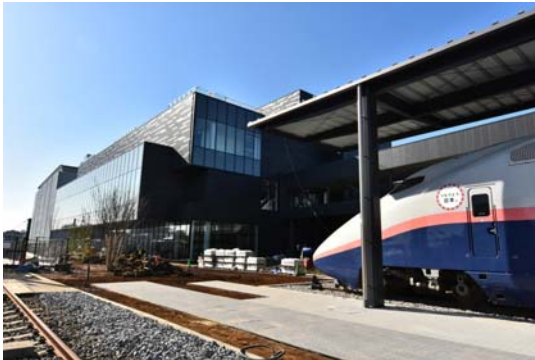
建設中の新館（2018年2月現在）