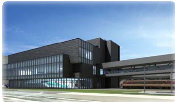
新館完成予想図（イメージ）