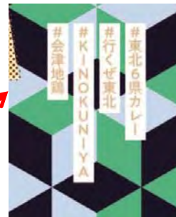
パッケージに描いた#（ハッシュタグ）