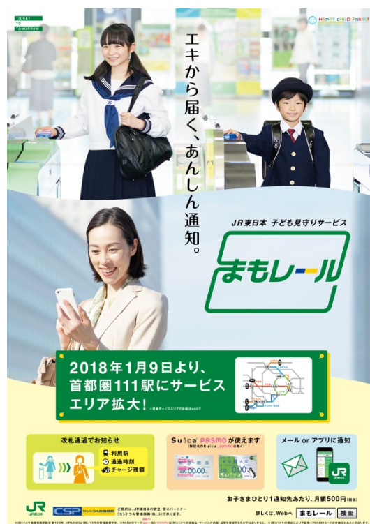
「まもレール」イメージポスター