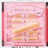
伊豆クレイル・華