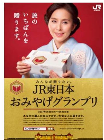
アンバサダーとして杉本彩さんを起用した メインビジュアル