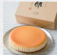
御用邸チーズケーキ