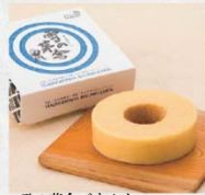
雪の茅舎バウムクーヘン