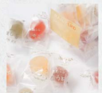
彩葉の宝石 (RY-1) レールヤードオリジナルヴァージョン