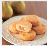
山形ラ・フランスガレット