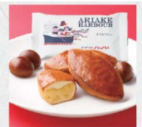
ありあけ横浜ハーバー ダブルマロン