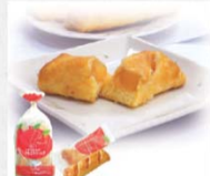
パティシエのりんごスティック