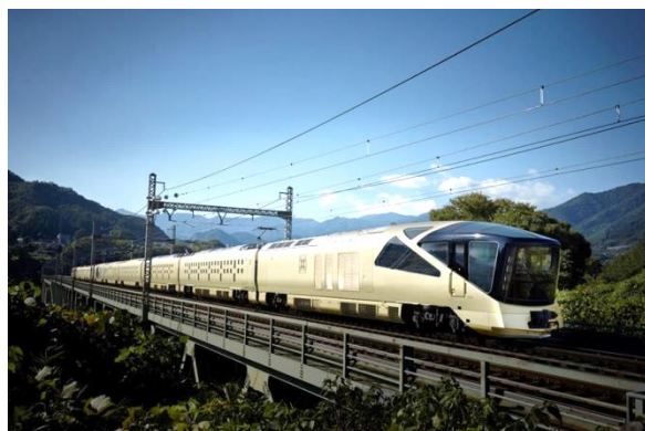
TRAIN SUITE 四季島