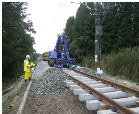
沿岸被災線区の復旧(常磐線)