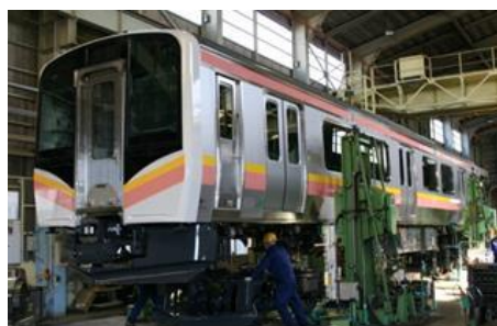
鉄道車両製造事業