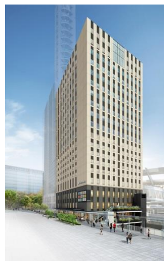
JRさいたま新都心ビル 「ホテルメトロポリタンさいたま新都心」