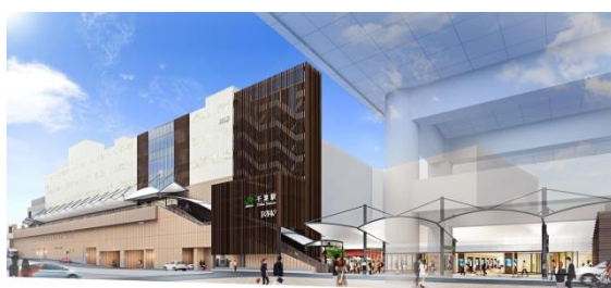
大規模ターミナル駅開発(千葉)