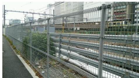
鉄道に関するセキュリティ強化(柵の設置)