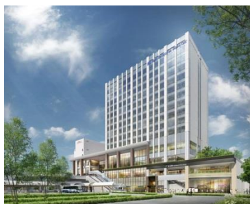
大規模ターミナル駅開発(仙台) 「ホテルメトロポリタン仙台イースト」