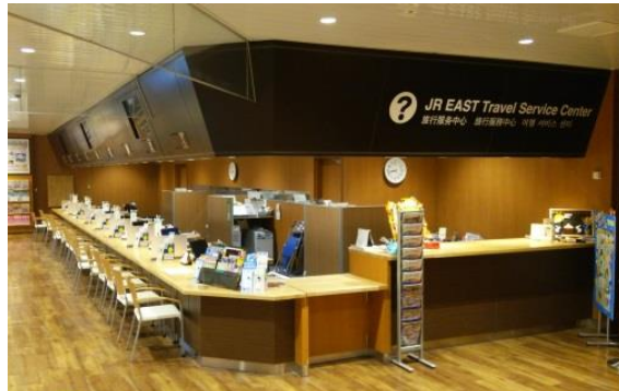
訪日旅客カウンター