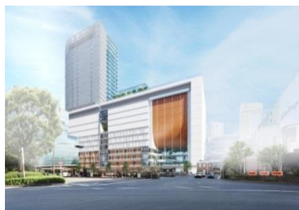
大規模ターミナル駅開発(横浜)