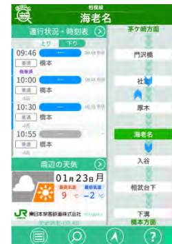
どこトレ線区表示画面