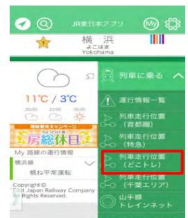
JR東日本アプリ表示画面