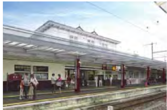
【図】1番線上家改良イメージ