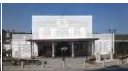
【工事期間中（仮囲い設置）】