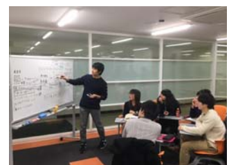
【学生の取組みイメージ】

栄養学に関する授業カリキュラムの中で、学生自ら地元の食材を生かしたメニュー企画を行います。アイデアをもとに商品を開発し、沿線の店舗にてお客さまに提供いたします。