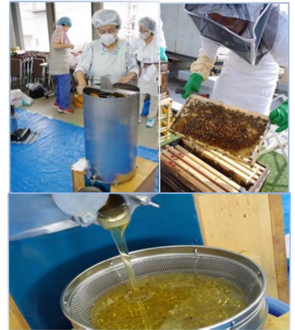
【戸田市商工会の採蜜】

参加条件：当日のビーンズ戸田公園でのお買い上げレシート合計1,500円以上(税込・合算可)提示。先着50名様限定(予定)