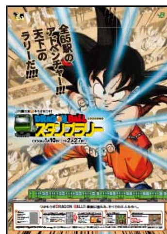
メインビジュアル（イメージ）

少年だった頃に夢中で集めた中年世代には懐かしい「オリジナルカードダス」や7つのドラゴンボールと神龍（シェンロン）を模した「オリジナルピンバッジ」などをプレゼントします。