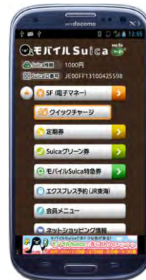
＜現在のトップ画面（スマートフォン）＞