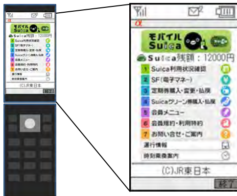
＜サービス開始当初のトップ画面 （フィーチャーフォン）＞

※ ビューカードでモバイルSuicaにご登録いただいた場合にご利用いただけます。