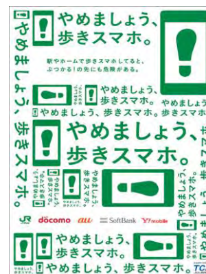
【キャンペーンポスター】