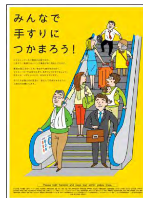
【キャンペーンポスター】