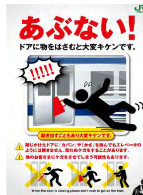
【キャンペーンポスター】