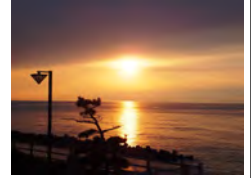
日本海に沈む夕日 (イメージ)

車内には沿線の観光ポイントをお楽しみいただける「きらきらプロジェクト(プロジェクト)」を設置。お酒や会話を楽しみながら、日本海の迫力ある風景を大きな車窓からお楽しみください。