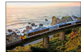
⑥リゾートしらかみ