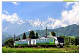
⑫リゾートビューふるさと