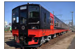
⑨フルーティアふくしま