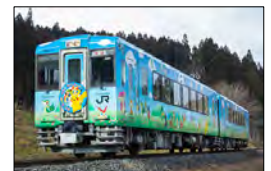
⑦POKÉMON with YOU トレイン