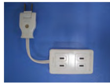
▲延長コードをつくろう