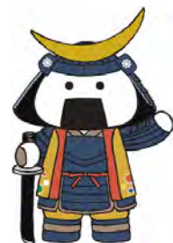
仙台・宮城観光PRキャラクター 「むすび丸」