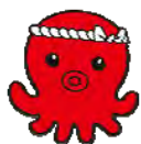
「オクトパス君」 (南三陸町)