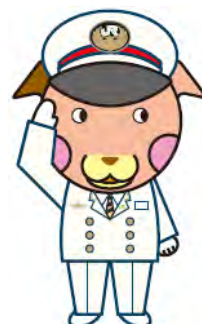
千葉支社マスコットキャラクター 駅長犬(えきちょうけん)