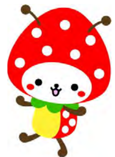
山武市マスコットキャラクター SUN ムシくん