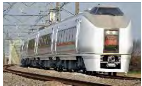
「スワローあかぎ」イメージ