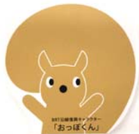
「おっぽくん」のメモ帳

今回出店のエリア(気仙沼市・大船渡市・南三陸町)は、地元や観光の足としてBRTがつなぐエリア。3つのブースを回ってクイズに正解すると、カワイイ BRT キャラクター「おっぽくん」のメモ帳等、沿線のご当地グッズなどをプレゼントします！