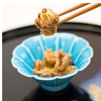
いか軟骨うま煮 <マルヌシ>

イカの軟骨を甘辛いオリジナルのタレに漬け込みました。八戸の漁師おすすめの珍味です。