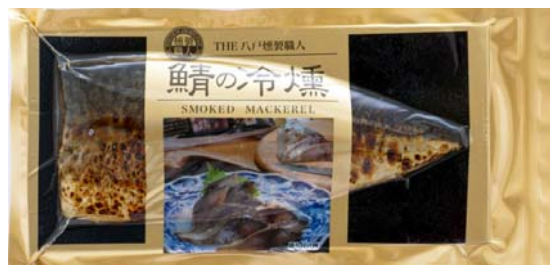
鯖の冷燻 <ディメール>

八戸で水揚げされた八戸前沖さばをじっくりスモークしました。とろけるような食感です。サラダやおつまみ、お茶漬けにおすすめです。