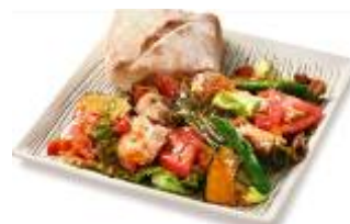
(福島県産川俣シャモサラダプレート)

手切りした生人参の歯ごたえを活かし、するめのダシと昆布・かつおだし、醤油で仕上げたイカを使った福島の郷土料理です。