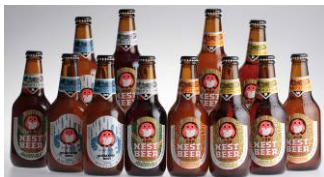
常陸野ネストビール 木内酒造

地元で、長い間愛されている、和菓子の名店のアップルパイです。奥久慈名産のリンゴを使用し、甘酸っぱく、しっとりとした食感です。