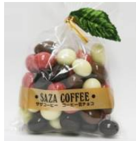
コーヒー豆チョコミックス サザコーヒー

茨城県はレンコンの生産量が日本一です。低湿地帯の肥えた土壌で育まれたレンコンは、サクサクとした食感で、煮物などに良く合います。