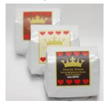
チョコレート風味3種のコーヒー サザコーヒー

国産大豆を使用し、大きさは超小粒の納豆です。わらに直接包まれ、その香りで納豆の風味が引き立ち、より美味しくいただけます。