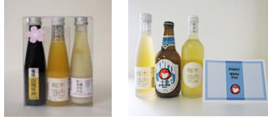
季節限定梅酒ミニボトルセット 木内酒造

濃厚で黄金色をした、奥久慈卵と、筑波山麓の牛乳を使用した茨城県産のプリンです。卵黄のコクと濃厚な牛乳が同時に味わえます。