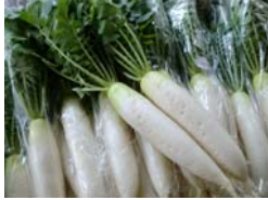
葉付大根 みずほの村

みずほの村の大根は、土にこだわり、ずっしり重く、どんな料理にもよく合います。さらに、葉もみずみずしく弾力があり、美味しく召し上がれます。