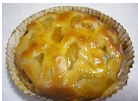
アップルパイ きね八

3月は、ほしいもが柔らかくなり、甘みが増す、1年の内で最も美味しい時期です。できたてのほしいもを、約30種類販売します。賞味期限が短いので、お早めにお召し上がり下さい。