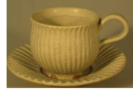
笠間焼 笠間焼協同組合

厳選された小豆の、甘さを抑えた餡に、餅が入ったボリュームたっぷりの絶品最中です。皮の香ばしさと程よい甘さが楽しめます。