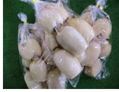
レンコン みずほの村

那珂川水系の井戸水と、イギリス等から選りすぐりの最上級の麦とホップを、酒造り180年の家伝の技で仕上げています。数々のコンテストで表彰されています。