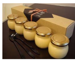
ゴールドプリン つくばプリンふじ屋

コーヒー豆を上質なチョコレートでコーティングした商品です。カリカリとした食感の中に、豆のほろ苦さと、チョコの甘さがミックスされています。ミルク、ビター、イチゴ、ホワイトの4種の味が楽しめます。