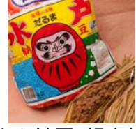
わら納豆(超小粒) だるま食品

日本酒、梅酒、甘酒が入って、家族の花見にぴったりな、春限定ミニボトルセットと、女性に喜ばれる、ホワイトデー限定のミニボトルセットを販売します。ホワイトデーのセットには特製カードとキャリーケースをお付けします。