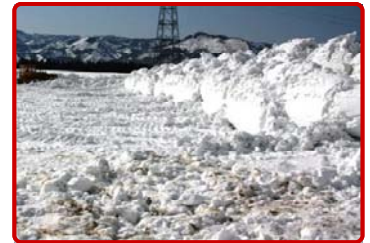
畑の雪を取り除くと高い雪の壁ができる