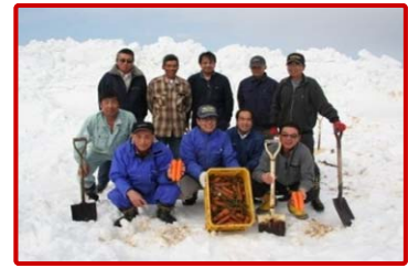
数少ない十日町市内の栽培農家