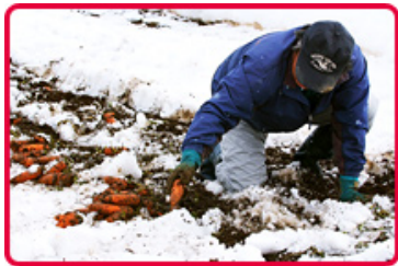
薄く残る雪の中から丁寧に人参を掘り出す