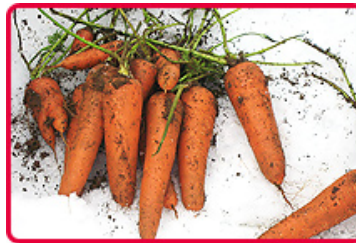
掘り出した妻有舞雪下になじん