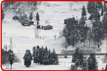
春でも雪深い十日町

「妻有舞 雪下になじん」は、たっぷりの完熟堆肥と有機肥料を使って作られた新潟県十日町市JA十日町のブランド「妻有舞になじん」を、雪の下で越冬させたものです。豪雪地域の十日町市では3月～4月でも雪が2メートル近く残ります。その雪をブルドーザーや投雪機を使って取り除きながら収穫します。作業が大変なうえ、雪が解けて、人参の芽が出てこない内に収穫しなければならないため、わずか13軒しか栽培していない貴重な一品です。雪の下で熟成させることにより、旨み成分である遊離アミノ酸や香りの成分が増すので、人参特有の青臭さが抜け、フルーツのような甘味がある美味しい人参です。