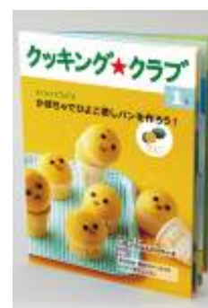
2012年4月開講 「クッキング クラブ」

「クッキング クラブ」は、小学3年生向けに2012年4月に新しく開講予定の、子どもが楽しく作れる料理をテーマにした食育・料理講座です。調理技術や食の知識を身につけながら、自分で計画して行動する自立心を育むことをねらいとし、12か月にわたって毎月季節に合った料理のテーマのテキストをお届けします。小学生の発達段階に合わせたレシピなので、輪切りやくし形切りなど包丁を用いた調理スキルをしっかり習得できるのはもちろん、食文化や食事の作法、片づけの仕方も写真を用いた詳しい解説で理解できます。