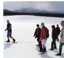
雪上トレッキング

「体験型イベント」と「体験型ツアー」は、小岩井農場の農業・自然体験プログラムや食育プログラムを展開する「エコファーマーミングスクール」とベネッセの通信教育「進研ゼミ小学講座」のオプション教材である『クッキングクラブ』・『かがく組』や、実験教室「ベネッセサイエンス教室」のコンテンツ・ノウハウを活かした内容としています。会場では、ベネッセの食育や科学に関する教材や教室の紹介も行います。