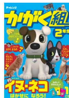
2012年4月開講 「かがく組2年生」

「かがく組」は、子どもの知的好奇心を育むのに最適な「小学2～4年生」という時期に、毎月1回、各学年の子どもにとって気になる科学テーマを楽しみながら体験できる講座です。2012年4月からは、これまでの「かがく組3・4年生」に加えて、小学2年生を対象とする新講座が開講します。小学2年生の子どもの発達に合わせて、子どもの「なんで?」「知りたい!」という知的好奇心を引き出し、多角的な視点で掘り下げていくことで、科学的思考力の素地を養います。