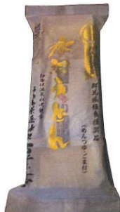
水沢うどん (有)牧商事

群馬県富岡市の有名なトマト「ぶんぶん」と「ま」とだけを使ったさっぱりとしたトマトゼリーです。