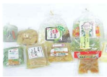
こんにゃく 昭和村商工会