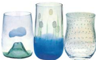
こだわりピアグラス 夕焼けのやま(左) ホタル(中)水泡(右) 上越クリスタル硝子(株)

一本一本手作りで丹精込めて作った純国産線香火花です。火花が大きく、まるで美しく咲いたなでしこの花のように見えることから「ひかりなでしこ」という名前をつけました。世界で2人しか作れない線香火花です。