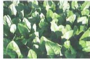
ほうれん草 昭和村産