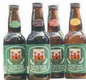
水と緑のエール(左) 蛍の里の黒ビール(左中) 夕陽の月夜野ピルスナー(右中) ロマンの里のヴァイツェン(右) 月夜野クラフトビール(株)

ガラス工芸の粋を極めた職人の技と感性が造る手づくりガラスは、豊かな独創性、芸術性に加え心に伝わるような温もりがあります。同じデザインのガラスでも、1つ1つ手作りのため、全てオンリー1商品です。