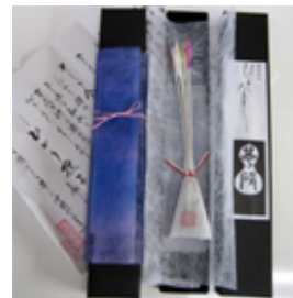
ひかりなでしこ (有)やまと火花

一本一本手作りで丹精込めて作った純国産線香火花です。火花が大きく、まるで美しく咲いたなでしこの花のように見えることから「ひかりなでしこ」という名前をつけました。世界で2人しか作れない線香火花です。