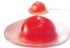
ぶんぶんトマトゼリー 田村製菓(有)

「さいしこみしょうゆ」は、厳選した丸大豆・小麦・天日塩を使用し、醤油づくりの基本「一麹、二糧、三火入れ」を守り時間をかけて作った昔ながらの手作り醤油です。