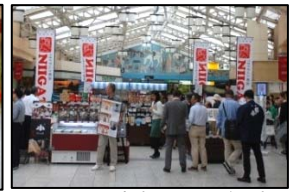
<産直市イメージ写真>