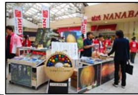
<観光PRブースイメージ写真>