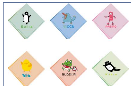
B コース ハンカチセット(イメージ)