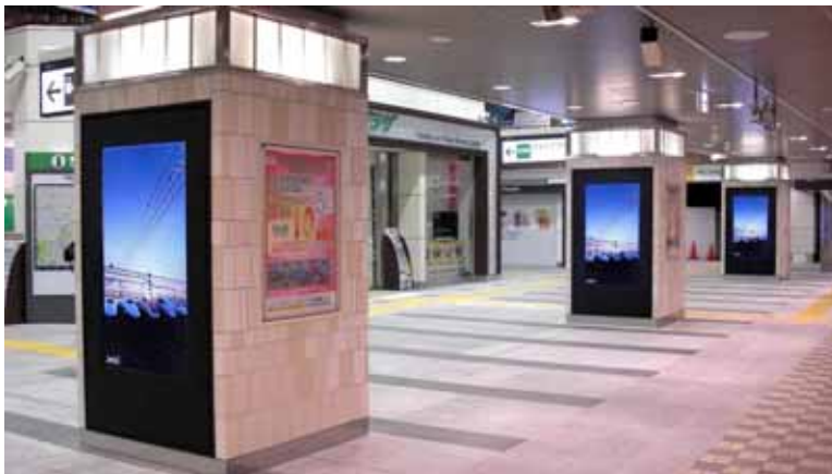
巣鴨駅 改札前 駅改良工事の環境デザインに合わせた設置