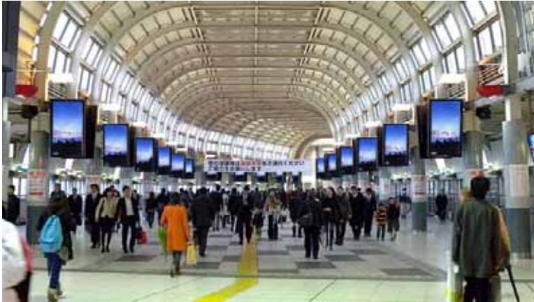
品川駅 中央通路 これまでで最大規模の 44 面を設置