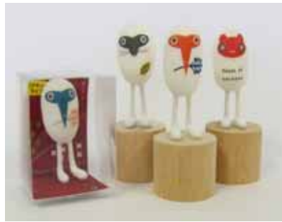
(大地の芸術祭関連グッズ)