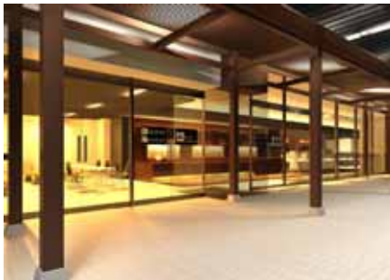
(ビジターセンターイメージ)