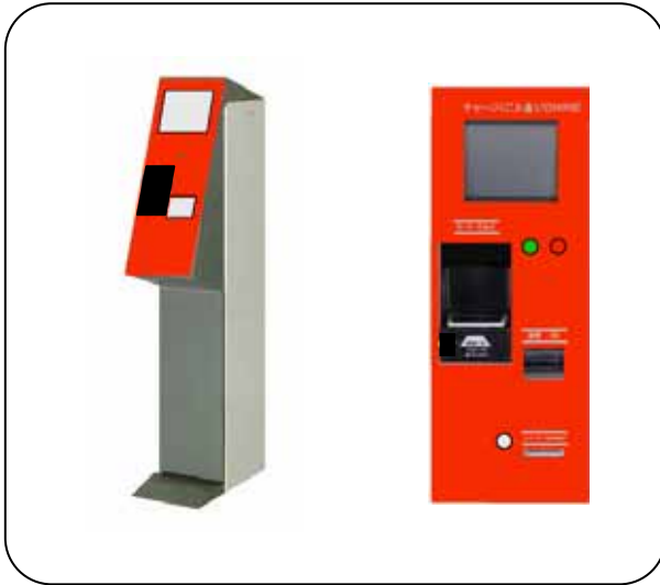
チャージ機 (イメージ)