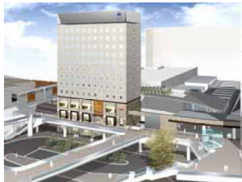
南口外観イメージ

電話予約 042-548-0011 ホームページ http://www.hotelmets.jp/