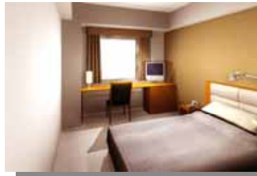
客室(シングルルーム)