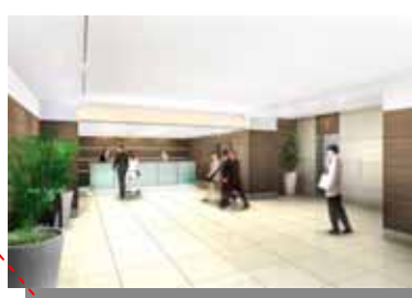
4階ホテルフロント