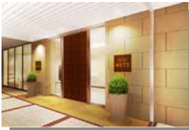
ホテル2階エントランス