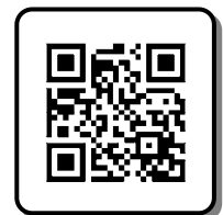
キャンペーンサイト QRコード

返信されたメールに記載された URL にアクセスし、Suica ID 番号と必要な項目を入力してエントリーしてください。