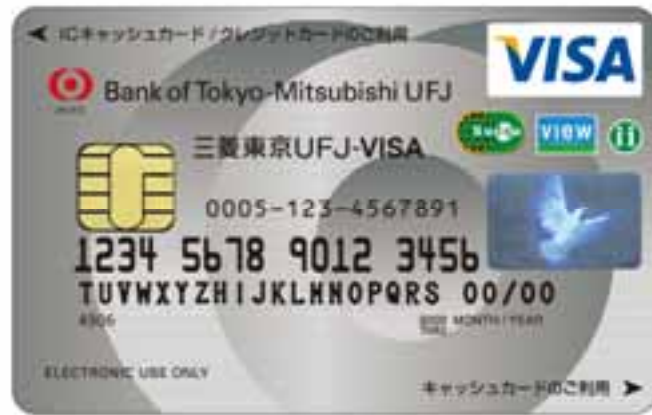
スーパーICカード Suica「三菱東京UFJ-VISA」(ゴールドカード)