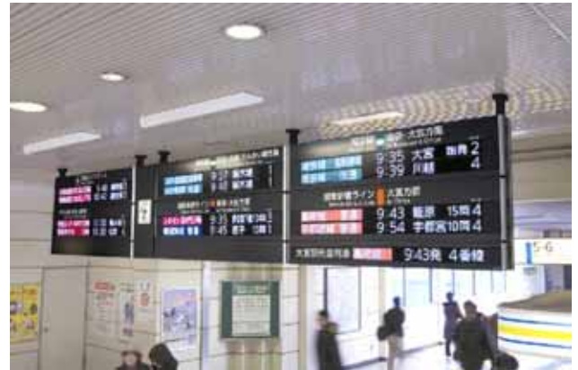
フルカラーLED（新宿駅）