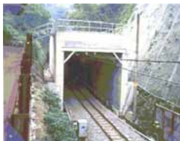
トンネル坑口部 [土砂止覆い工]