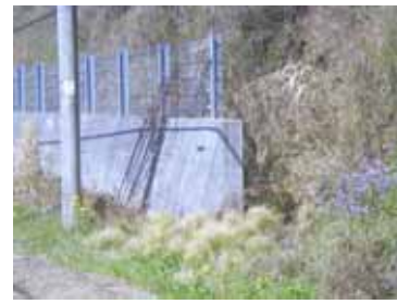
切取のり面 [土砂止擁壁]