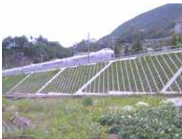
盛土のり面 [のり面防護工(コンクリート製)]

なお、今後も引き続き、2008年度末までに降雨防災強化対策工事を推進して行きます（全体工事費約230億円）。