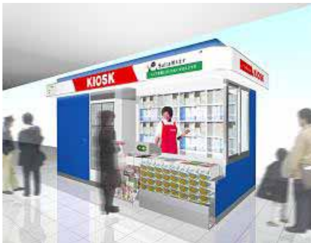
(Suica 対応キヨスク売店)