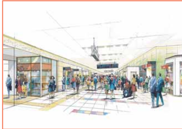
パス②: アベニューのイメージ 大勢の人が行き交う大通りに沿ってバラエティ豊かなショップが軒を連ねる