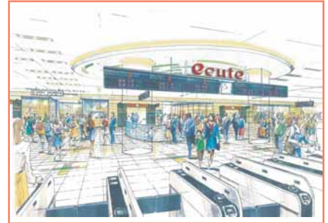
パス③: 南改札口付近 改札を入ると、魅力的なエキナカ空間「ecute」が広がる