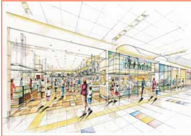
パス①: アベニューよりABゾーン 開放感のある高い天井を活かし、中3階を設けた立体的な空間