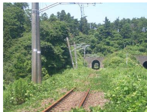
広野・木戸間 電化柱傾斜